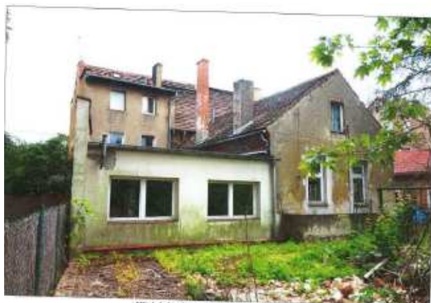
Widok budynku z przeciwnej strony.