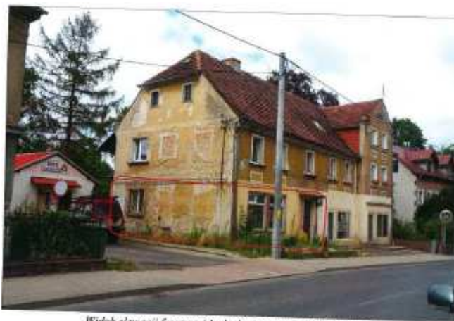
Widok elewacji frontowej budynku z zaznaczeniem lokalu L2.

na sprzedaż lokalu przeznaczonego na cele inne niż mieszkalne Nr L2, znajdującego się w budynku położonym w Lubaniu przy Armii Krajowej 2 wraz z udziałem we współwłasności nieruchomości gruntowej (działka nr 74/1, AM 2, Obręb III o powierzchni 1400 m 2 , JG1L/00030661/0).